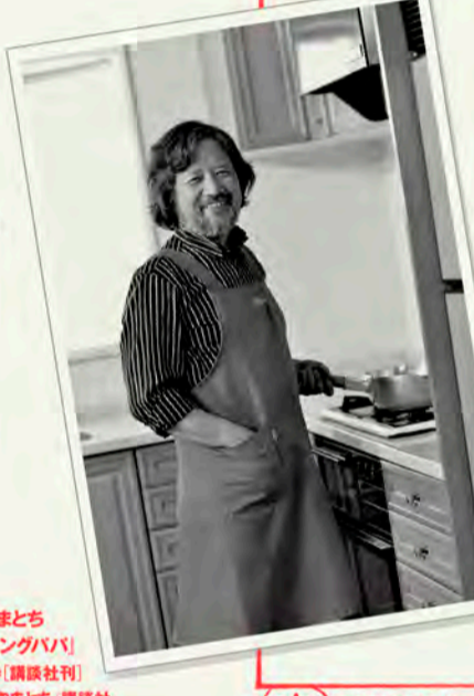
うえやまとち「クッキングパパ」142巻(講談社刊) ©うえやまとち 講談社

福岡県出身。1954年生まれ。1979年、「週刊少年キング」少年画報社にて、「であい」はるきくんの日記」でデビュー。1985年、「モーニング」講談社にて、「クッキングパパ」の連載を開始。現在も続いている2017年8月現在最新刊142巻。同作は、1992年にテレビアニメ化。その後、実写ドラマ化などもされた。同作に対して、2015年度第39回講談社漫画賞特別賞が贈られた。