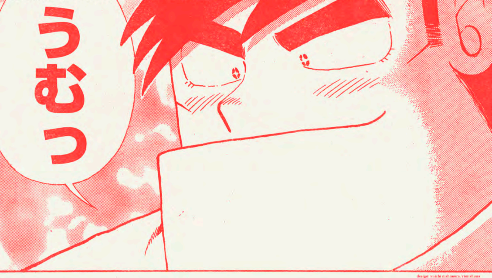
design: yuichi nishimura / rimishuna

第1期 [東アジア文化都市2017京都コア期間事業] 2017年9月16日[土]→11月19日[日] 第2期 [京都国際マンガミュージアム企画事業] 2017年11月23日[木]→2018年1月14日[日] 展示替え期間 / 閉場期間 | 2017年11月20日[月]→22日[水] / 閉館時間 | 10:00-18:00 [最終入館は17:30 9月16-17日は20:00まで開館] 休館日 | 毎週水曜日、10月8日[日]、12月28日[木]、1月4日[木] 会場 | 京都国際マンガミュージアム2階ギャラリー1/2/3 [京都市中京区烏丸通御池上ル] 料金 | 無料 (ただし、ミュージアム入場料 [大人800円、中高生300円、小学生100円] は別途必要) *11月6日[月]は関西文化の日につき入場無料